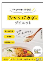
価格:1200円税別 出版:セブン&アイ出版

◆4月27日刊行「おからパウダーダイエット」著 岸村康代 スーパーで手軽に購入できるおからを乾燥させた「おからパウダー」。このおからパウダーを料理に“いれるだけ、かけるだけ、まぜるだけ”で内臓脂肪&中性脂肪がダウン、腸内細菌の悪玉菌が減少したという忙しい現代人には大変うれしい結果を分かりやすくレポート。さらにダイエットだけでなく、便秘解消や肌荒れ改善、生活習慣病予防、女性ホルモン様作用など、健康・美容にもおすすめです。